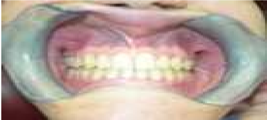
Figura 9 Vista frontal de la paciente al finalizar el tratamiento, obsérvese oclusión de los caninos.