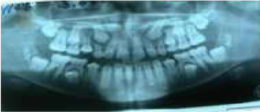
Figura 1. Control de brote.

se le indica un aparato tipo Hawley con rejilla para el control de la lengua. La condición de los caninos superiores permanentes se mantiene en control de brote a la expectativa por la edad de la paciente para su evolución en posteriores consultas.Figura 1.