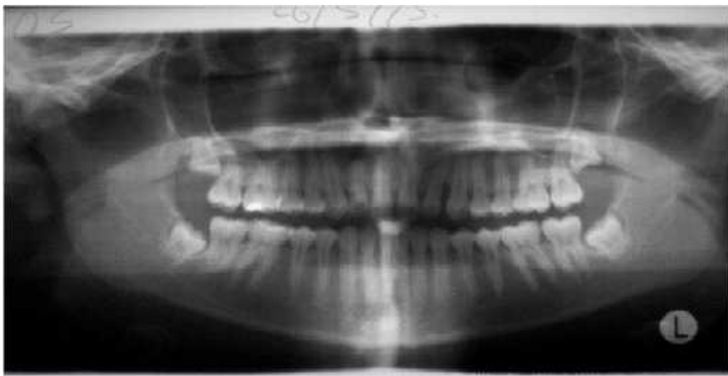
Figura 8 RX panorámica al finalizar el tratamiento.